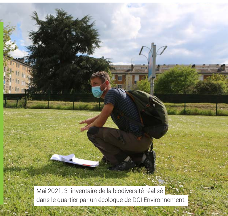
Mai 2021, 3 e inventaire de la biodiversité réalisé dans le quartier par un écologue de DCI Environnement.

Le pilotage et le suivi du dispositif ont été confiés à la Fabrique Emploi et Territoires (ex Maison de l'emploi), conjointement avec le PLIE (Plan local pluriannuel pour l'insertion et l'emploi) de Nevers Agglomération. La mise en œuvre et le suivi des clauses sociales sont assurés par les facilitatrices de la Fabrique. Elles ont pour rôle d'accompagner les maîtres d'ouvrage, les entreprises, les partenaires de l'emploi et de l'insertion et de participer à des actions de promotion des clauses sociales dans le département de la Nièvre.