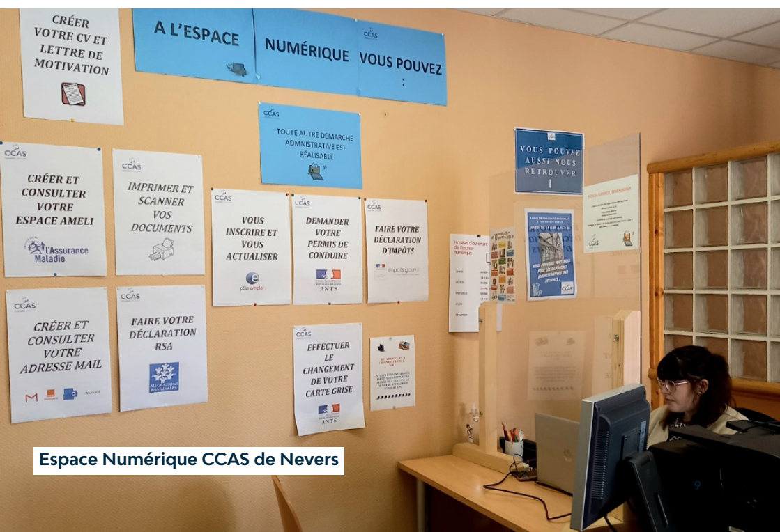
Espace Numérique CCAS de Nevers