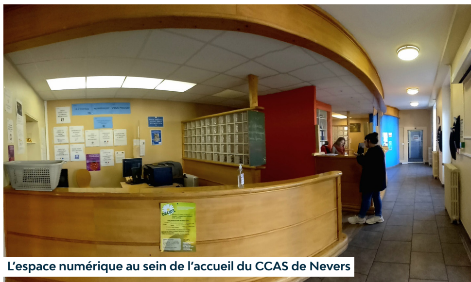
L'espace numérique au sein de l'accueil du CCAS de Nevers